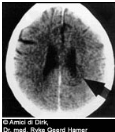
© Amiel di Dirk, Dr. med. Ryke Geerd Hamer

Dieren beleven deze biologische shocks op een letterlijke manier. Zij lijden bijvoorbeeld een conflict door een plotseling verlies van het nest of territorium, het verlies van een jong, de scheiding van een partner of van de kudde, de onverwachte dreiging te verhongeren of een doodsangst. Omdat in het verloop van de tijd de menselijke geest een figuurlijke manier van denken heeft ontwikkeld, kunnen wij deze biologische conflicten ook in overdrachtelijke zin ervaren. Een man kan bijvoorbeeld een 'territoriumverlies conflict' lijden als hij onverwachts zijn huis of zijn werkplek verliest. Een vrouwelijk 'nestconflict' kan de bezorgdheid zijn over het welzijn van een van de leden van het 'nest', een 'verlatingsconflict' kan worden getriggerd door een onverwachte scheiding of een plotselinge ziekenhuisopname. Kinderen kunnen een 'scheidingsconflict' lijden als mamma besluit weer te gaan werken of als de ouders uit elkaar gaan.