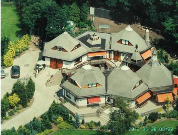
De Pentahof, eigen ontwerp op basis van de "Heilige Geometrie", en geheel zelfstandig gebouwd, vanaf 1988 aan de Harskamperweg 5, Kootwijkerbroek