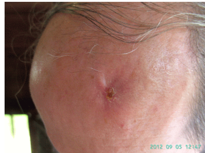
Figuur12 foto is vandaag gemaakt 05-09-2012