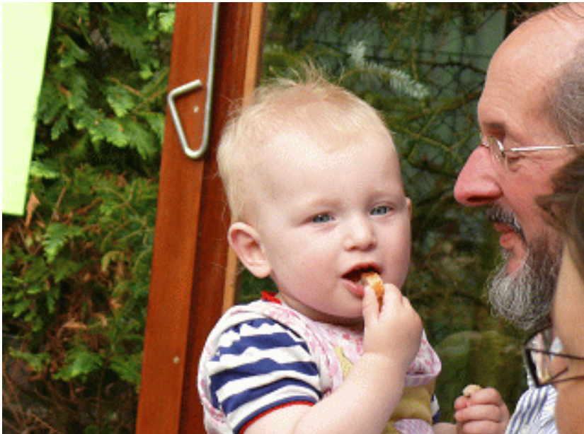
Deze foto is gemaakt in het najaar 2011. Het plekje op mijn hoofd was uitwendig klein en niet opvallend, zoals op deze foto blijkt. Het zat meer onderhuids.

De broer van mijn schoonzoon is verleden jaar op 35 jarigeleeftijd aan kanker overleden, na een lange slepende weg langs het reguliere pad.